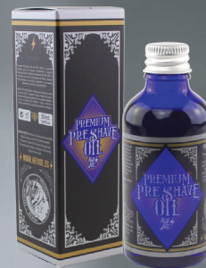
PREMIUM PRE-SHAVE OIL OLEJEK PRZED GOLENIEM

TESTOWANY DERMATOLOGICZNIE Pojemność: 150 ml