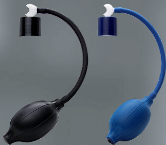
VAPIRIZER BLACK/BLUE ROZPYLACZ DO WODY PO GOLENIU