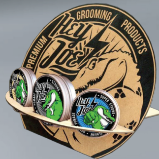
ESPOZYTOR NA POMADY