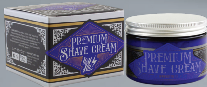
PREMIUM SHAVE CREAM KREM DO GOLENIA

HEY JOE! Premium to krem do golenia zawierający naturalne emolienty, ułatwiające prowadzenie ostrza, minimalizując podrażnienia skóry. Jego specjalna formuła szybko wytwarza gęstą i kremową pianę, skracając czas golenia i zapewniając doskonałe rezultaty.