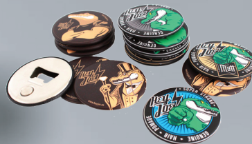
OTWIERACZ DO BUTELEK