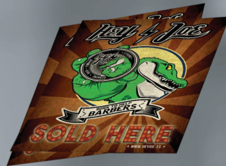
PLAKAT HEY JOE!