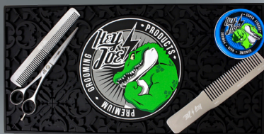
RUBBER TOOL MAT GUMOWA MATA NA PRZYBORY

TESTOWANY DERMATOLOGICZNIE Pojemność: 50 ml