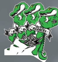
NAKLEJKI HEY JOE!