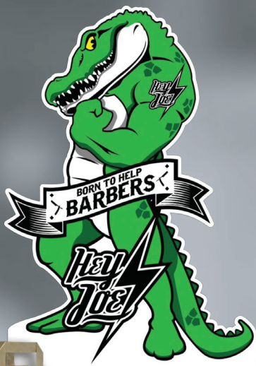
STAND HEY JOE!